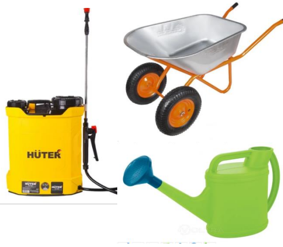
- оборудование садовое; -субстрат (грунт питательный); -удобрения в ассортименте; -семена, саженцы в ассортименте.