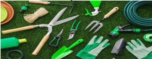
-инструменты садовые в ассортименте;