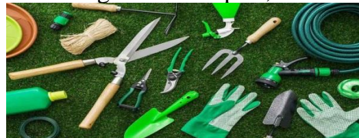
- garden tools;