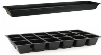
- containers and cassettes for seedlings;