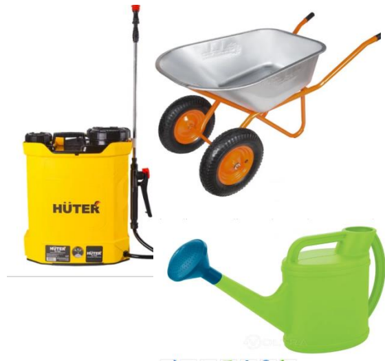
- garden equipment; - substrate (nutrient soil); - assorted fertilizers; - assorted seeds and seedlings.

Общий объём финансирования (в долларах США) – 3000$ Источник финансирования: Средства донора - 3000$ Софинансирование – 0