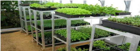
-стеллажи для рассады-10 шт. ;